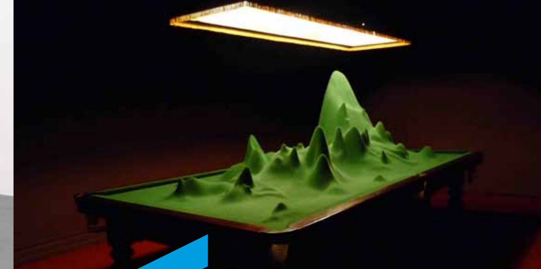
Stéphane Thidet, Sans titre (Je veux dire qu'il pourrait très bien exister, théoriquement, au milieu de cette table [...]) , 2008 (détail). Installation (200 x 400 x 180 cm). Collection Frac Alsace