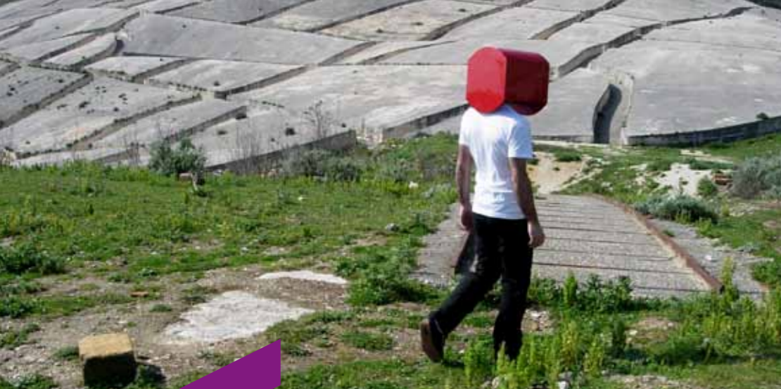
Raphaël Zarka, Cretto , 2005 (détail) Vidéo couleur sonore (durée: 6'45"). Collection Frac Alsace © Raphaël Zarka / Vue de tournage: Cécilia Becanovic