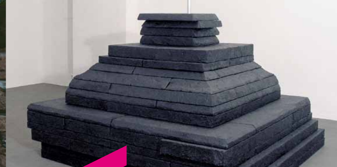
Peggy Buth, Monument , 2005 (détail) Techniques mixtes (215 x 220 x 245 cm environ). Collection Frac Alsace