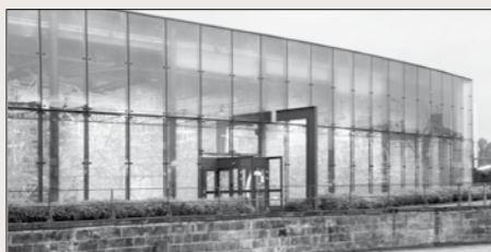
© Frac Alsace (Exposition Jan Kopp. Photo: JB Dorner)