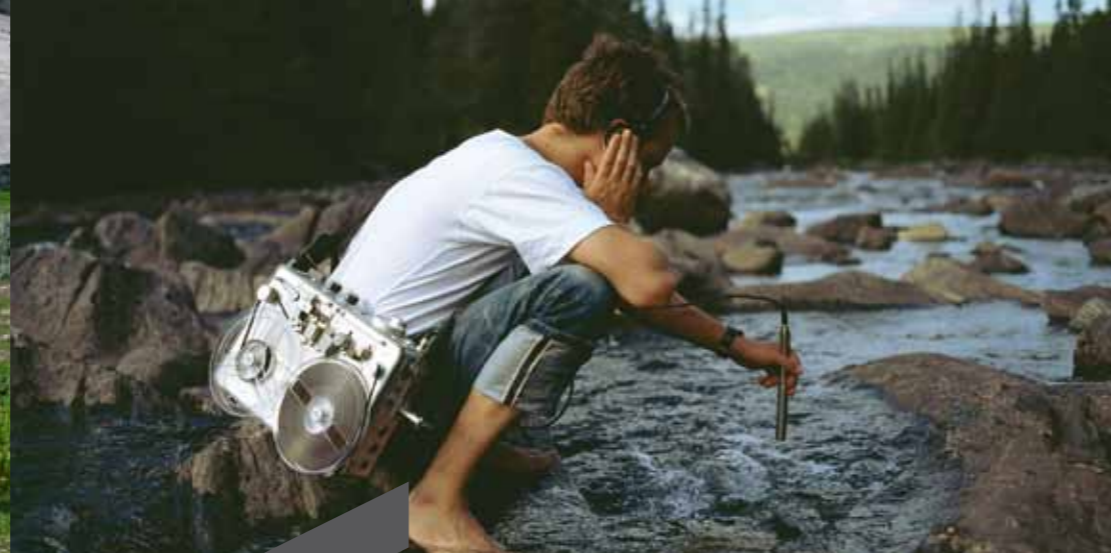
Laurent Montaron, The Stream , 2007 (détail) Photographie couleur (123 x 155,5 cm). Collection Frac Alsace